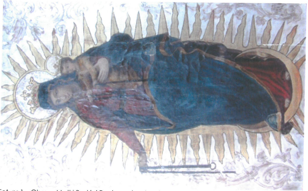
Fot. nr 1 – Obraz „Matki Boskiej Pocieszenia „ bez koszulki.