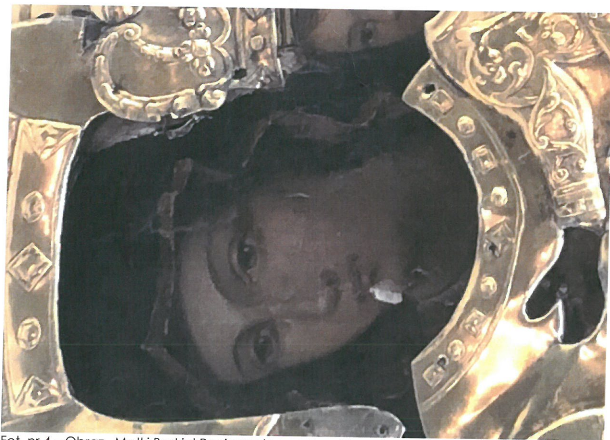
Fot. nr 4 – Obraz „Matki Boskiej Pocieszenia w srebrnej koszulce wotywniej – fragment. Widoczne ubytki warstwy malarskiej na twarzy Matki Boskiej.