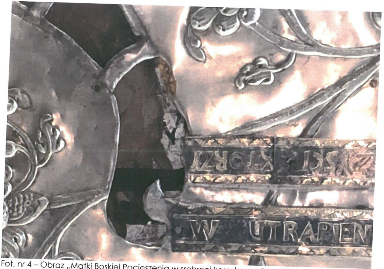
Fot. nr 4 – Obraz „Matki Boskiej Pocieszenia w srebrnej koszulce wotywniej – fragment. Widoczne zniszczenia warstwy malarskiej i pozłoty w obrębie dłoni Matki Boskiej.