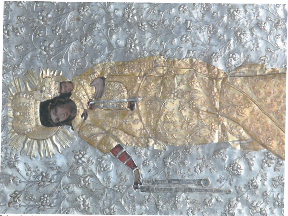
Fot. nr 2 – Obraz „Matki Boskiej Pocieszenia w srebrnej koszulce wotywnej.