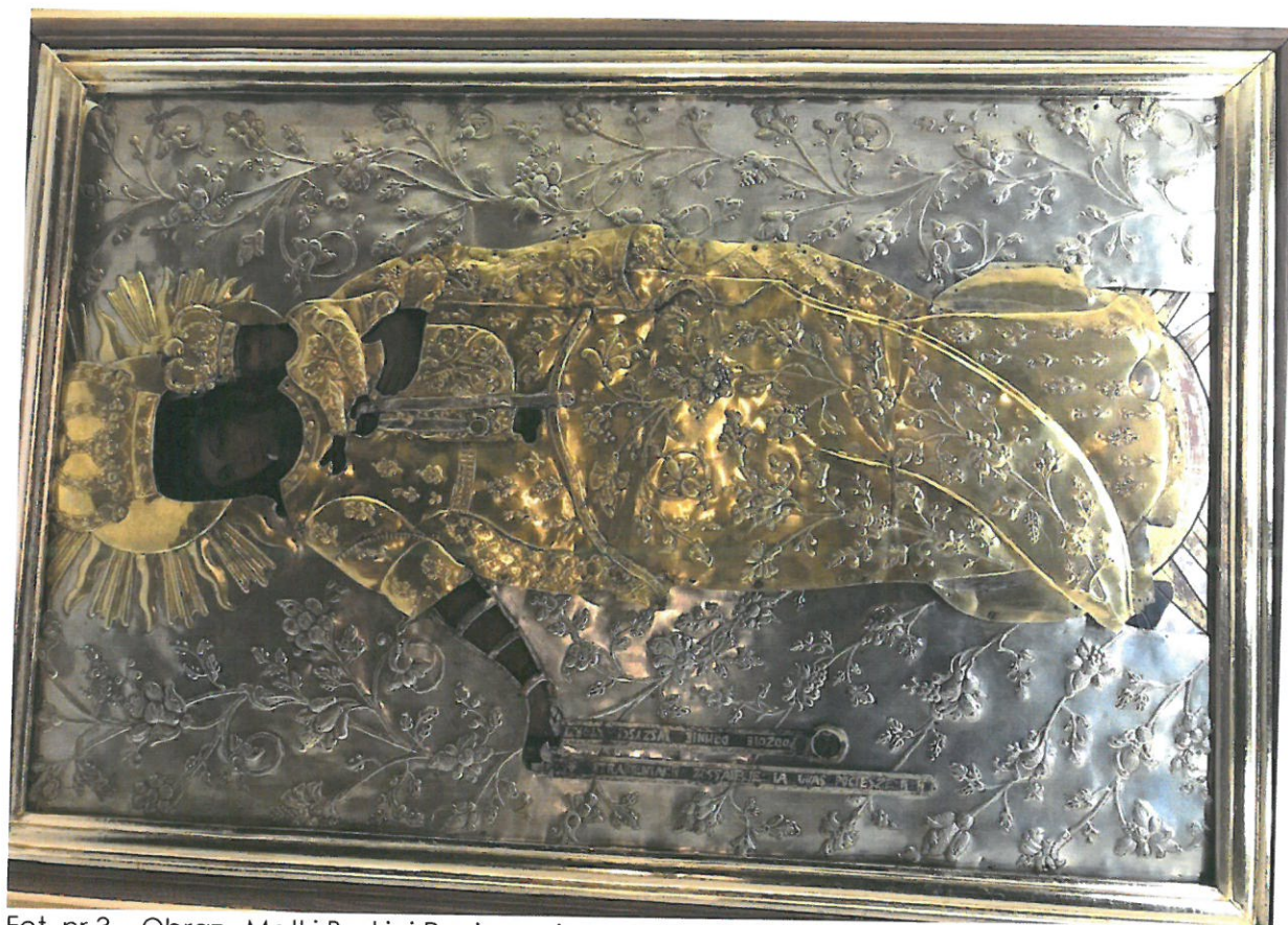
Fot. nr 3 – Obraz „Matki Boskiej Pocieszenia w srebrnej koszulce wotywniej.