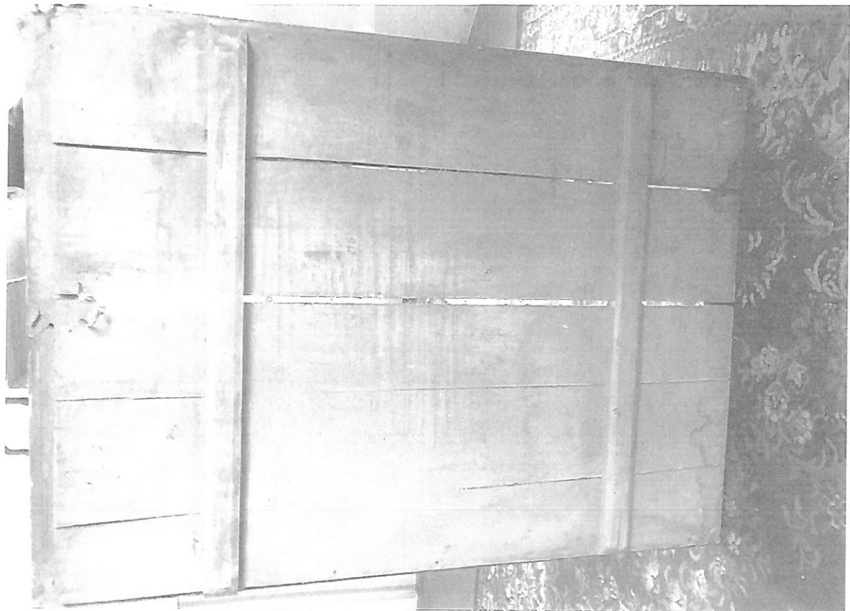
Fot. nr 2 – Obraz Matki Boskiej z Dzieciątkiem – odwrocie. Stan przed konserwacją.