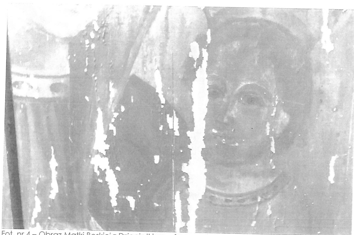
Fot. nr 4 – Obraz Matki Boskiej z Dzieciątkiem – fragment. Stan przed konserwacją.