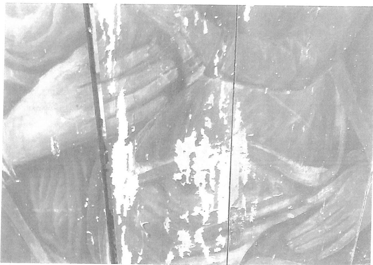
Fot. nr 5 – Obraz Matki Boskiej z Dzieciątkiem – fragment. Stan przed konserwacją.