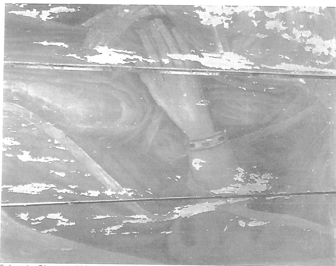
Fot. nr 6 – Obraz Matki Boskiej z Dzieciątkiem – fragment. Stan przed konserwacją.