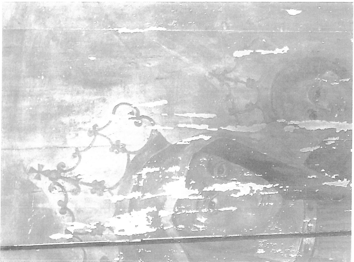
Fot. nr 3 – Obraz Matki Boskiej z Dzieciątkiem – fragment. Stan przed konserwacją.