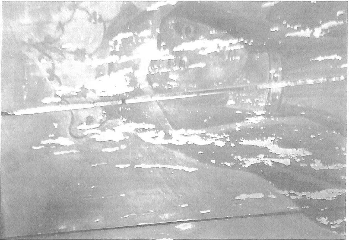
Fot. nr 7 – Obraz Matki Boskiej z Dzieciątkiem – fragment. Stan przed konserwacją.