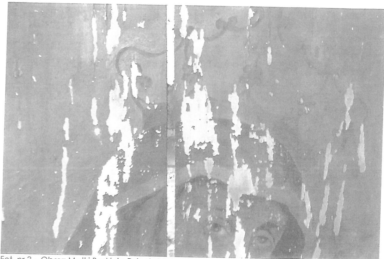
Fot. nr 3 – Obraz Matki Boskiej z Dzieciątkiem – fragment. Stan przed konserwacją.