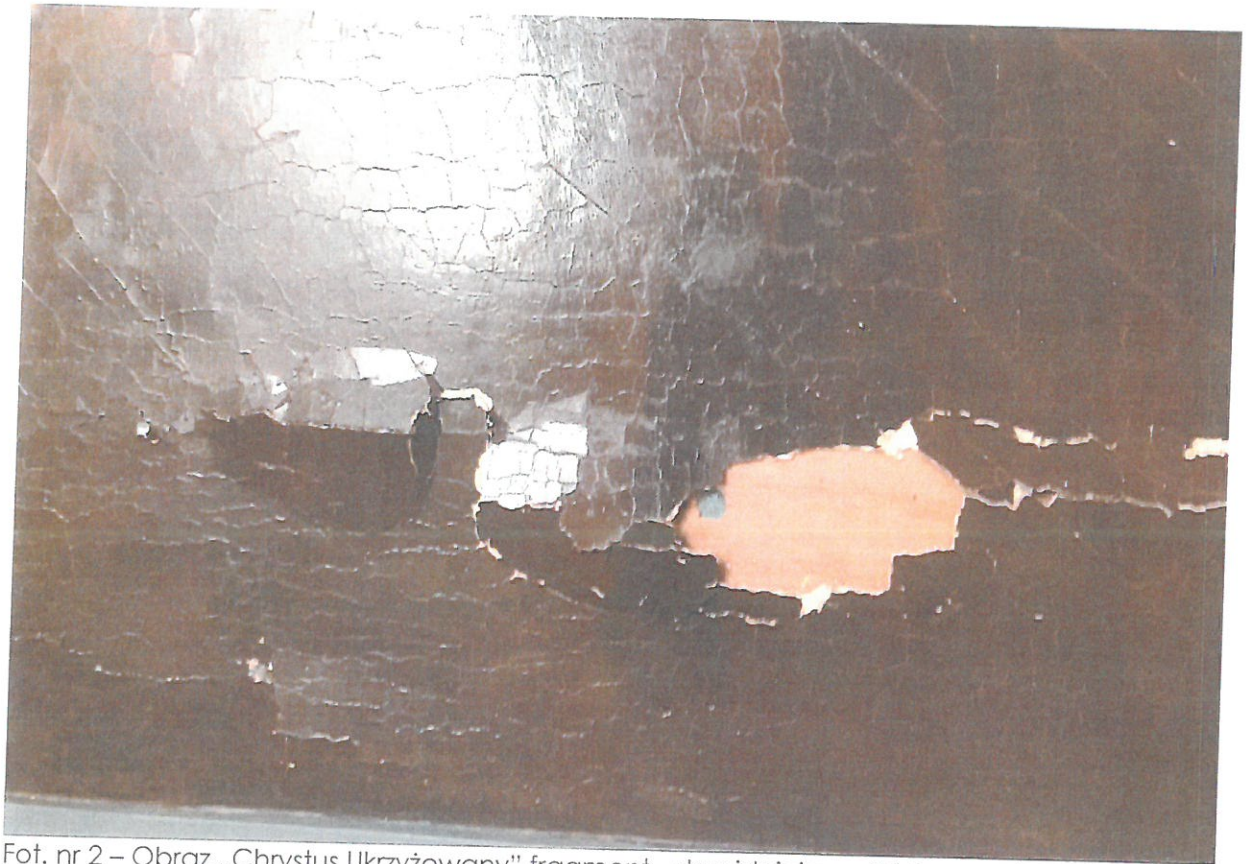
Fot. nr 2 – Obraz „Chrystus Ukrzyżowany” fragment - stan istniejący. Widoczne duże złuszczenia warstwy malarskiej.