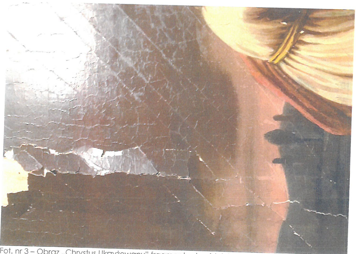
Fot. nr 3 – Obraz „Chrystus Ukrzyżowany” fragment - stan istniejący. Widoczne duże złuszczenia i odspojenia warstwy malarskiej.