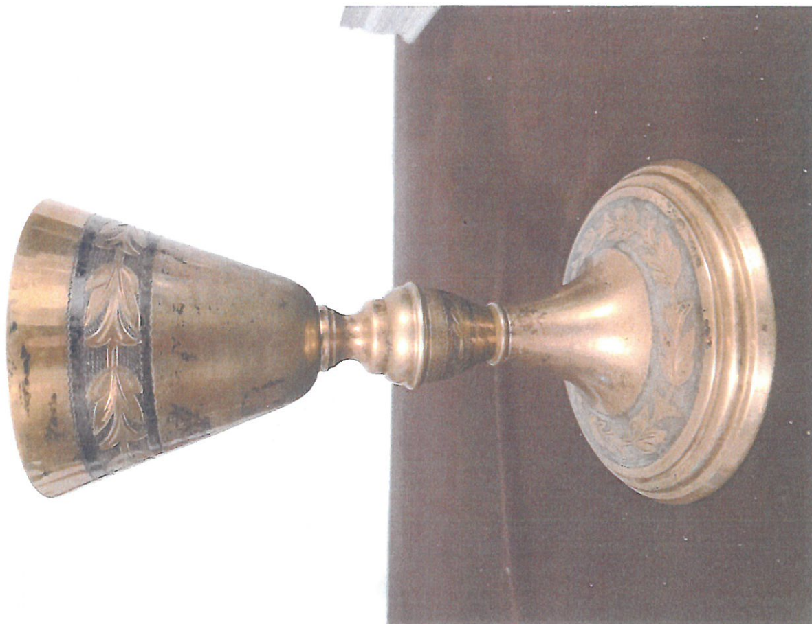
Fot. nr 1 – Kielich - stan istniejący.