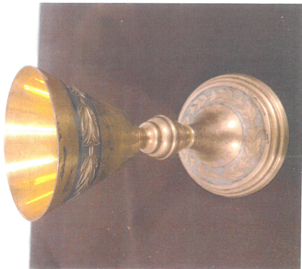
Fot. nr 2 – Kielich. Widoczne zniszczenia spowodowane utlenieniem srebra .