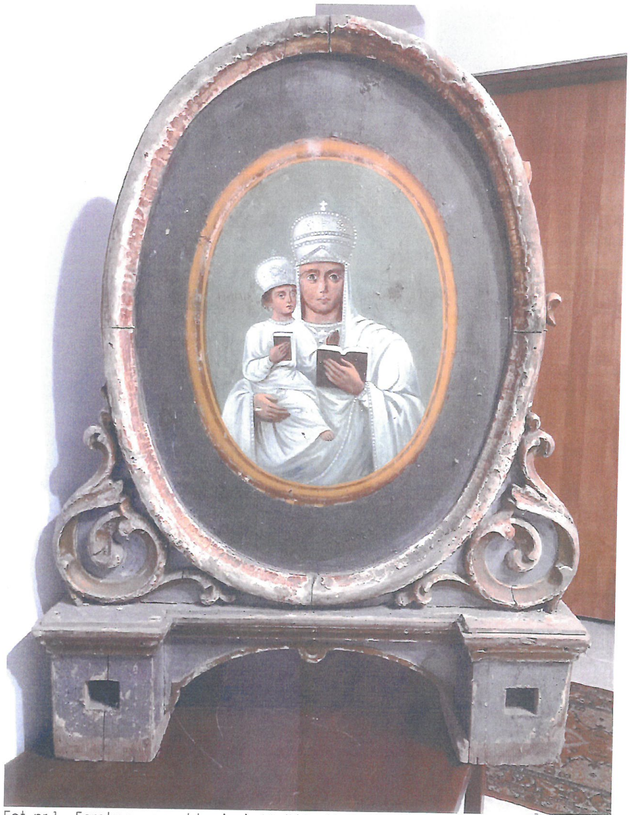
Fot. nr 1 – Feretron – przedstawienie Matki Boskiej Leśniowskiej – stan przed konserwacją.