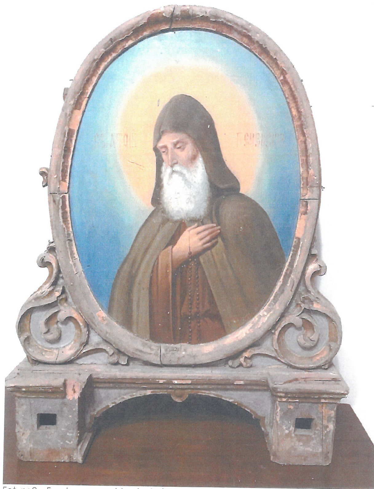
Fot. nr 2 – Feretron – przedstawienie św. Antoni Pęczerski – stan przed konserwacją.